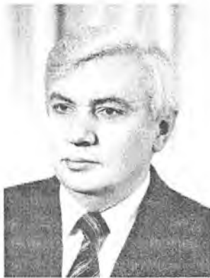
ДЭКАН МЕХАНІКА- МАТЭМАТЫЧНАГА ФАКУЛЬТЭТА — ПРАФЕСАР Мікалай Іосіфавіч ЮРЧУК

Падрыхтоўка па спецыяльнасці матэматыка вядзецца на навукова-педагагічным аддзяленні, навукова-вытворчым аддзяленні і наступных, маючых індывідуальныя вучэбныя планы, спецыялізацыя: матэматычная электроніка, камп'ютэр-