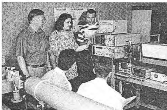
Заняткі на факультэце радыёфізікі і электронікі

Чакаем вас на факультэце радыёфізікі і электронікі!