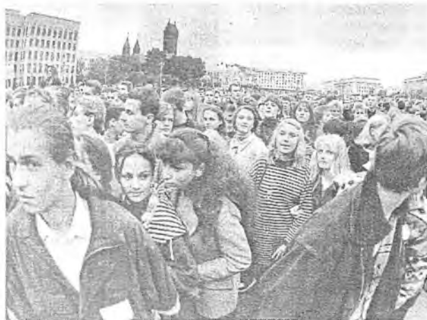
На «Дні Ведаў—98»

Студэнты аддзялення інфармацыі і камунікацыі вывучаюць адну з самых перспектыўных і папулярных сфер сацыяльных навук — тэорыю і практыку міжасабовай, арганізацыйнай, палітычнай, міжнароднай і іншых відаў камунікацыі, асвойваюць вялікі цыкл дысцыплін па новых інфармацыйных тэхналогіях на сучаснай тэхнічнай базе. Выпускнікі гэтага аддзялення маюць магчымасць знайсці дастасаванне атрыманым ведам і навыкам у прэс-службах і службах па сувязях з грамадскасцю, менеджменце, рэкламе, а таксама ў многіх іншых накірунках дзейнасці дзяржаўных і недзяржаўных структур.